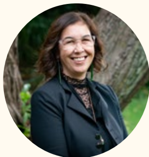
Rawinia Higgins 教授 副校长 惠灵顿维多利亚大学

我们的大学;我们的员工;我们的学生以及我们的学生社团都已经做好准备,我们将尽全力支持你,让你的留学之旅充满意义!